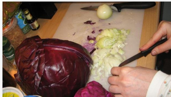
Förbederd kål och lök

Skär rödkålen enligt önskan upp i små eller grövre bitar. Vi föredrar grövre bitar. Kålen kokas i en srör gryta och kommer att sjunkas ihop jejljt. Bifoga lite äpple och fett, det ger en bra smak.