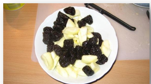
Fyllning: Äpple och plommon