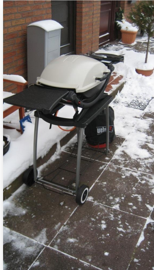
Grillning på gång